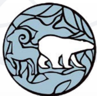
Заповедник БОЛЬШОЙ АРКТИЧЕСКИЙ